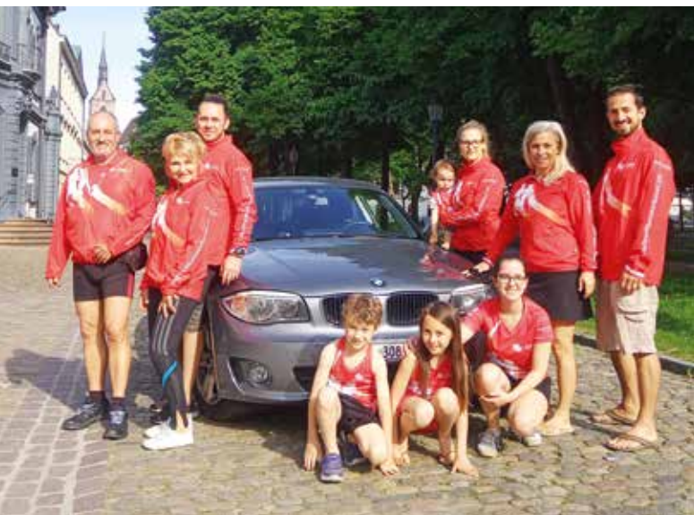
Laufbegeisterung kennt keine Altersgrenzen: Drei Generationen beim Lauftreff beider Basel.