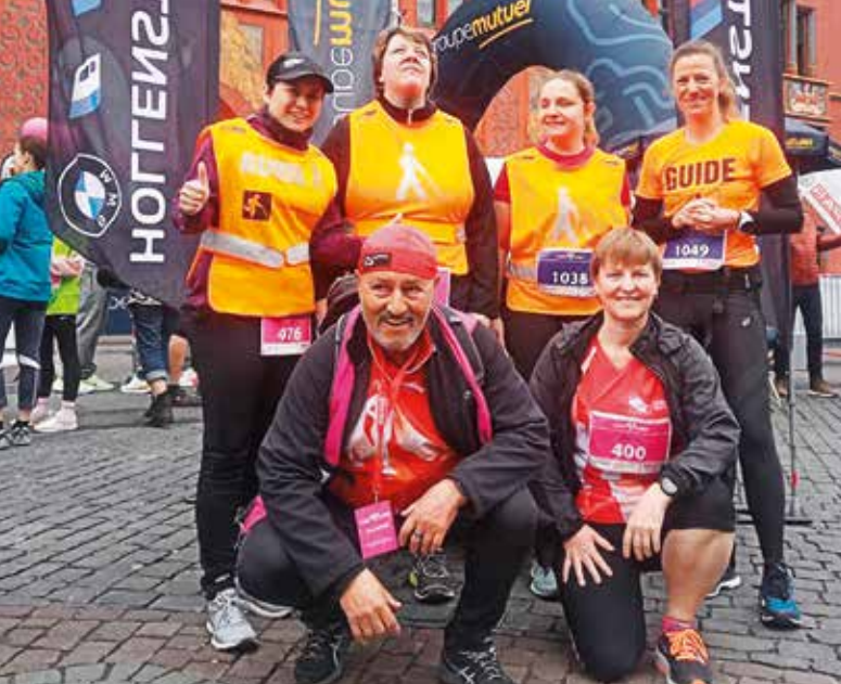
Kein Laufereignis ohne fleissige Helferinnen und Helfer. Unter ihnen auch Mitglieder des Lauftreffs beider Basel.